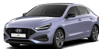
Meta Blue Pearl Perleťová Cena: 16 900 Kč