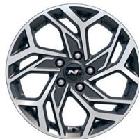
17" kola z lehké slitiny – N Line