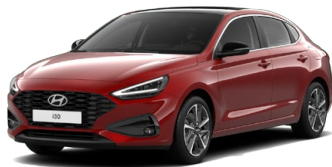
Ultimate Red Metallic Metalická Cena: 16 900 Kč