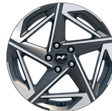
18" kola z lehké slitiny – N Line

* K dispozici pro vozy vyrobené do 9/2024.