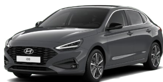
Ecotronic Gray Pearl Perleťová Cena: 16 900 Kč