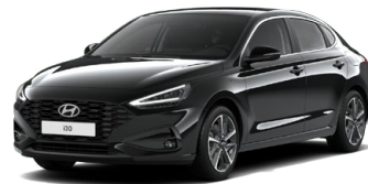
Abyss Black Pearl Perleťová Cena: 16 900 Kč