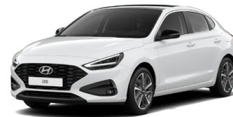
Serenity White Pearl Perleťová Cena: 16 900 Kč