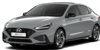
Shadow Gray Pastelová Cena: 16 900 Kč Dostupná pouze pro výbavy N Line