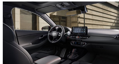
Černý interiér N line – látkové čalounění s červeným prošíváním a logem N – černé čalounění stropu a obložení bočních sloupků – červeně prošívání sportovní volant, hlavice řadící páky a loketní opěrka