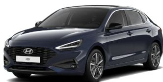
Sailing Blue Pearl Perleťová Cena: 16 900 Kč