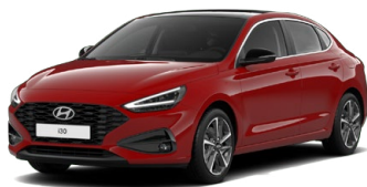
Engine Red Pastelová Cena: 0 Kč