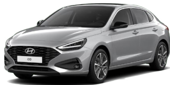
Shimmering Silver Metallic Metalická Cena: 16 900 Kč