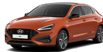
Jupiter Orange Metallic Metalická Cena: 16 900 Kč