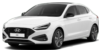
Atlas White Pastelová Cena: 5 900 Kč