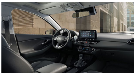
Černý interiér Oceanidis Black – látkové čalounění sedadel – světlé čalounění stropu a obložení bočních sloupků – černé provedení přístrojové desky a výplní dveří