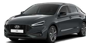
Cypress Green Pearl Perleťová Cena: 16 900 Kč